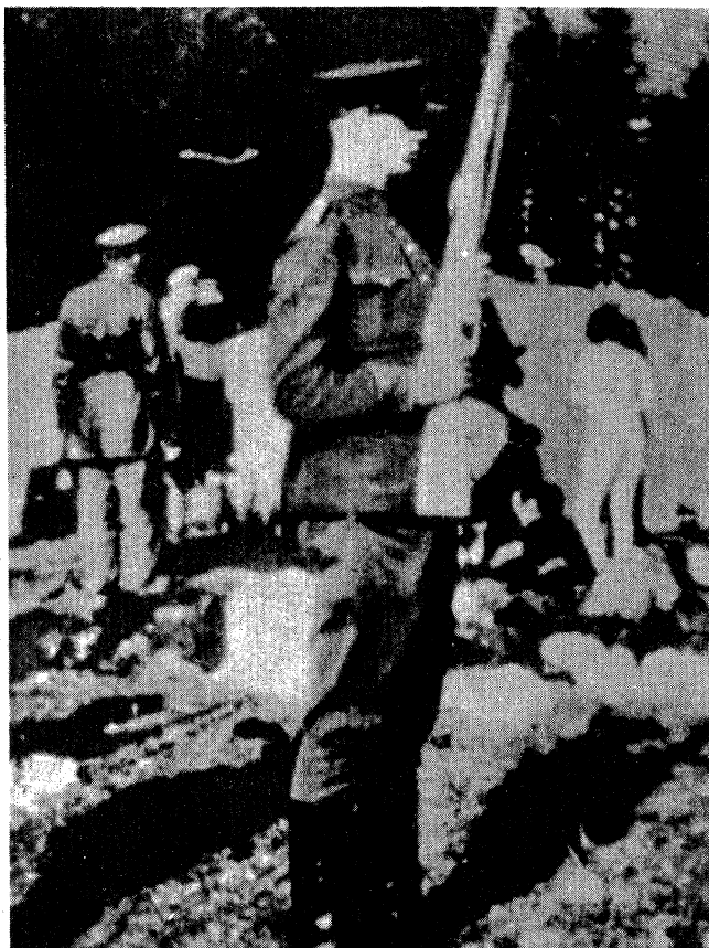
דער אומקום פון די יידן אין אליטע. ליטע 1941. דער ליטווישער באַנדיט האָט זיך אויסגעפּוצט מיט זיינע בעסטע קליידער אויפן יום-טוב ער האָט אפילו אָנגעטאָן אַ פאַר כראָמענע שטייול, ווייל געוויינלעך פלעגן זיי גיין אין קלומפּעס. (הילצערנע פּאַנטאַפּל).